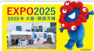
2025年大阪・関西万博ブース